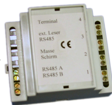
Abb.: optionale Relaisbox