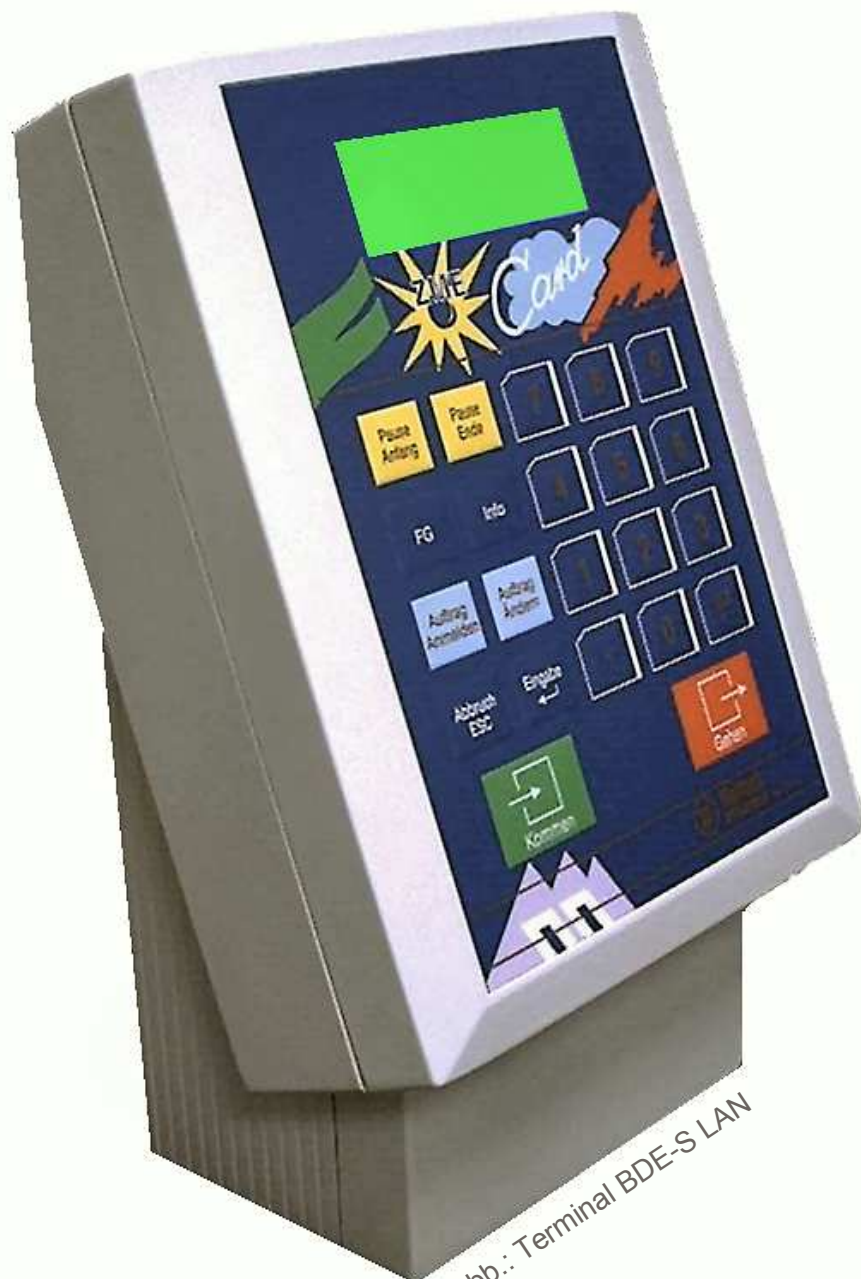
Abb.: Terminal BDE-S LAN

Kleine bis mittelständige Unternehmen, Verwaltungen, Büros, Praxen und Kanzleien, die eine auftragsbezogene und kostengünstige Zeiterfassung benötigen.